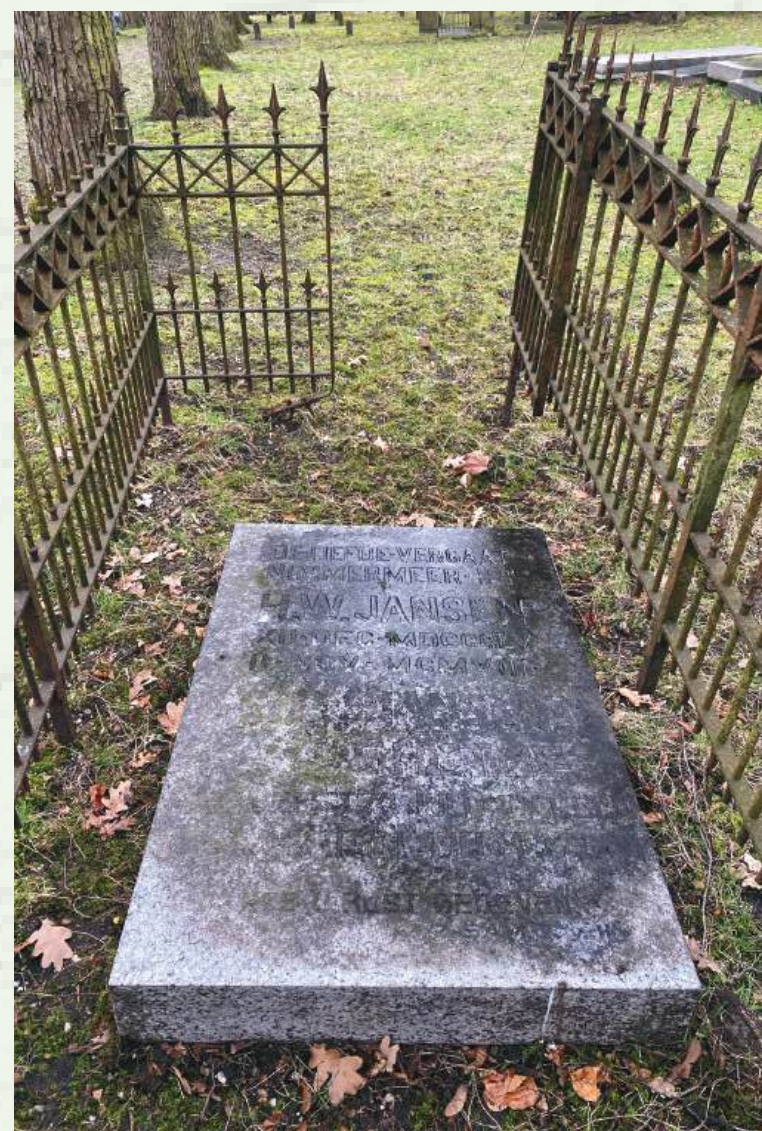
Graf E133 (tijdelijk verplaatst)

Na het overlijden van haar man in 1908 kocht Sophia een grafkelder, graf E133, op de Oude Algemene Begraafplaats. Sophia overleed te Zeist op 1 juli 1926 en werd bijgezet in graf E133 voorzien van een granieten deksteen met opschrift en wordt omringd door een smeedijzeren hekwerk.