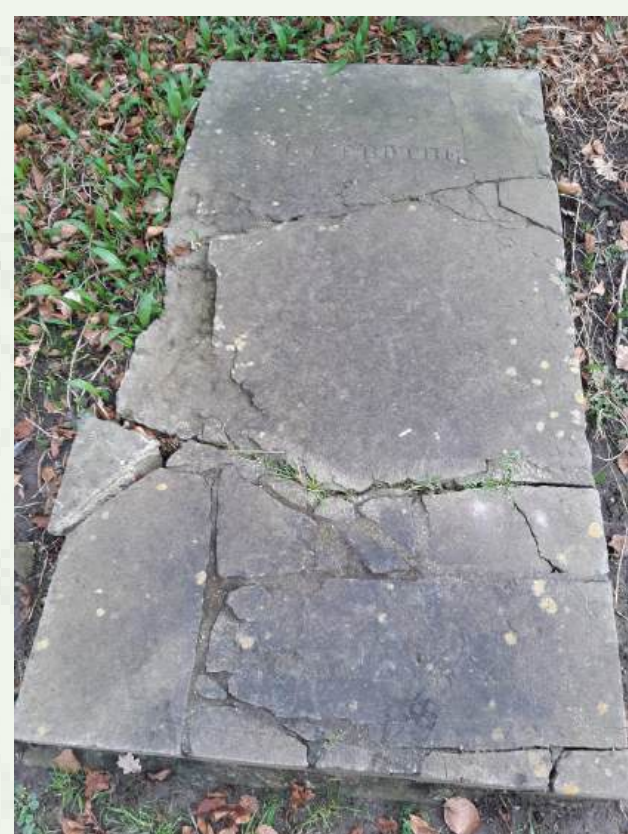
Gebroken dekplaat met inscriptie J. T. GROTHE gelegen in het park bij het Slot.