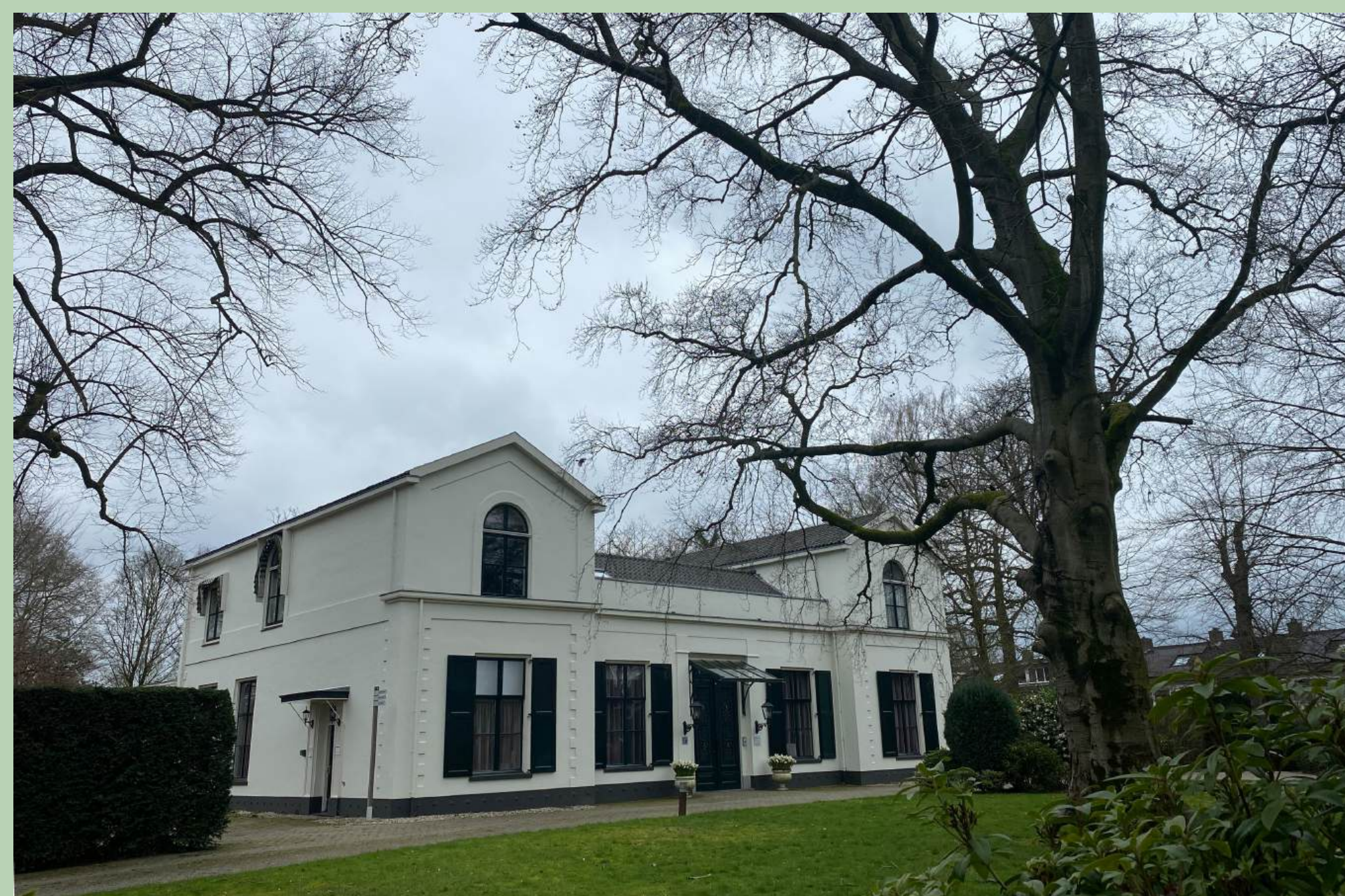
Het geheel witgepleisterde huis Nijenheim anno 2023 met in de voortuin nog enkele oude beuken.