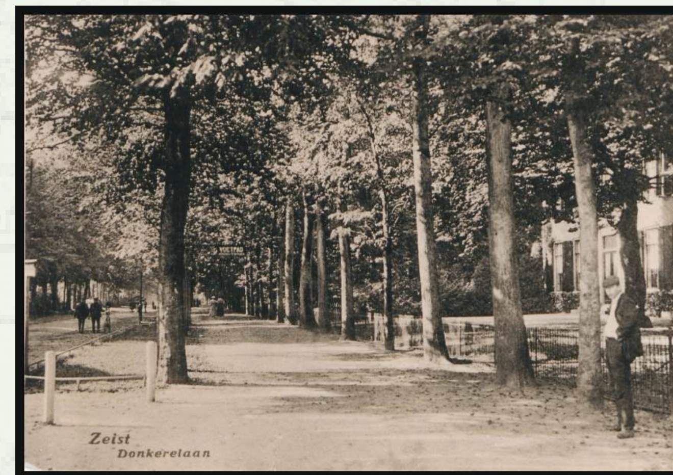
De Donkerelaan met rechts Huis ten Bosch.