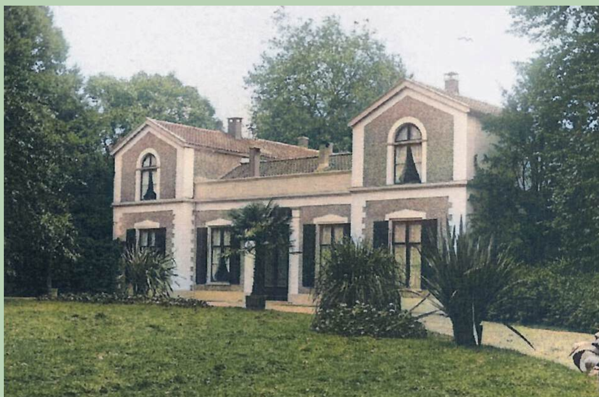
Het huis Nijenheim anno 1907 met kuipplanten langs de oprijlaan